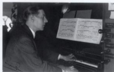
Aan het orgel van de Doopsgezinde Vermaning in Alkmaar.