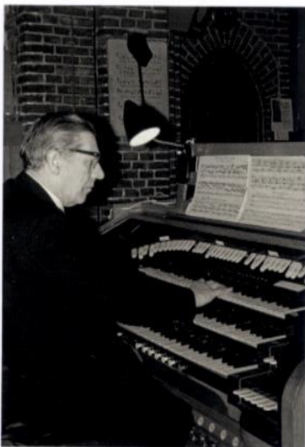
Aan het orgel van de Petrus en Pauluskerk in Bergen N.H., 13 januari 1967.