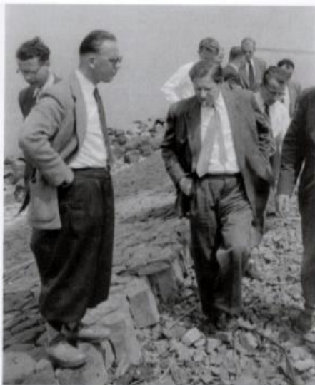
Met collega's van de Cultuurtechnische Dienst op werkbezoek (ca. 1953).