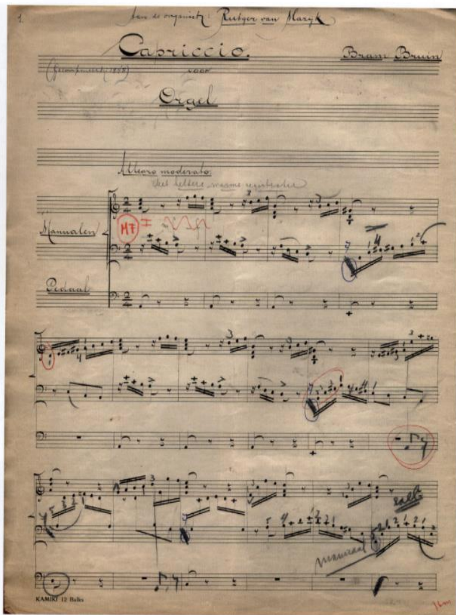
Eerste pagina van het onuitgegeven Capriccio .